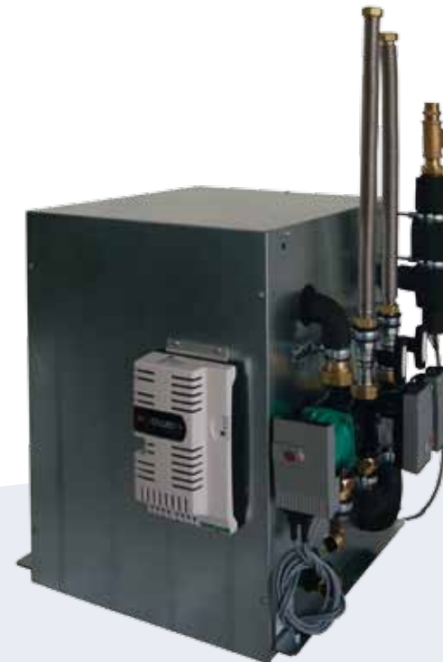
EM III i , Sole/Wasser EM III i , Brine/Water